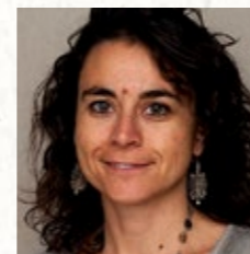
Leitung: Silke Weiß